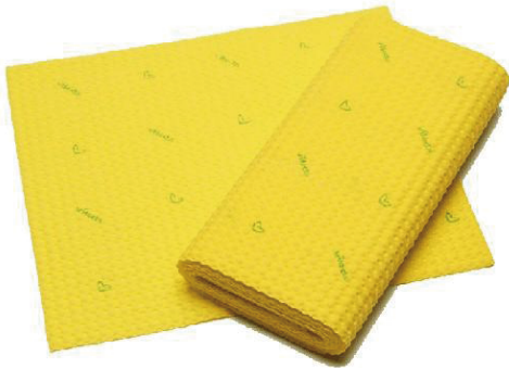
Bayeta multiusos / Sponge cloth

1.- Necesitarás algunas herramientas para aplicar las calcas / You will need some tools to apply water decals: