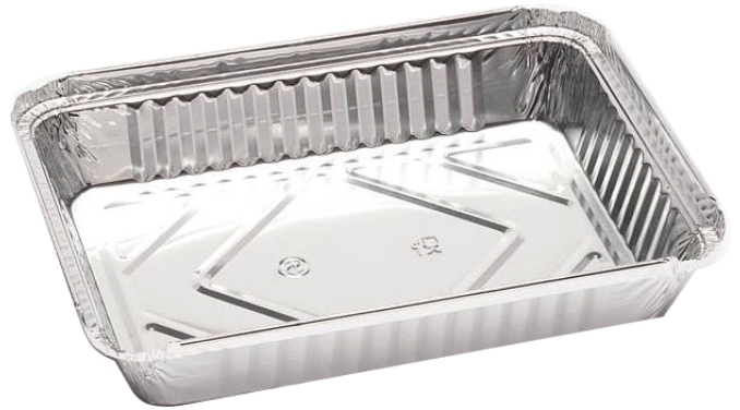
Bandeja de aluminio / Aluminum food tray