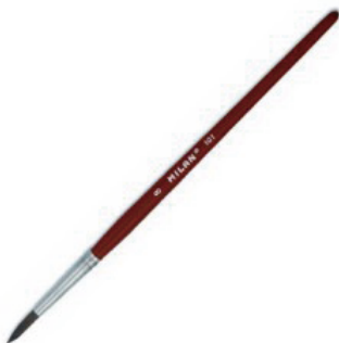
Pincel / Brush