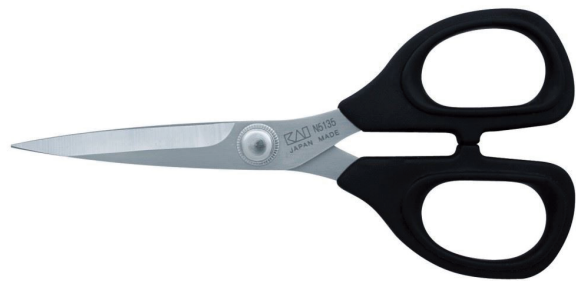
Tijeras / Scissors