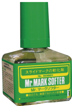
Ablandador de calcas / Decal softener